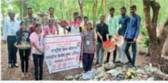
म्हसदी : धनदाईदेवी मंदिर परिसरात कचरा, प्लॅस्टिकमुक्त अभियान राबविताना देवरे महाविद्यालयाचे राष्ट्रीय सेवा योजनेचे स्वयंसेवक.