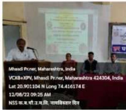
Mhasdi Prner, Maharashtra, India VCXB+XPV, Mhasdi Prner, Maharashtra 424304, India Lat 20.901104 N Long 74.416174 E 12/08/22 09:25 AM NSS क. व. पी. उ. म. वि. नागपूरकर दिन