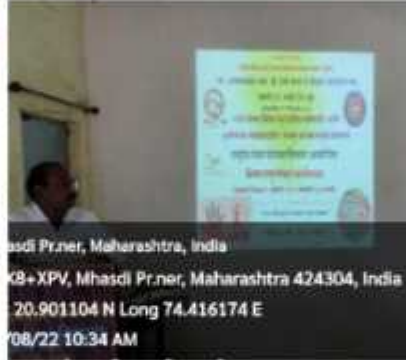
Mhasdi Prner, Maharashtra, India VCXB+XPV, Mhasdi Prner, Maharashtra 424304, India Lat 20.901104 N Long 74.416174 E 12/08/22 10:34 AM