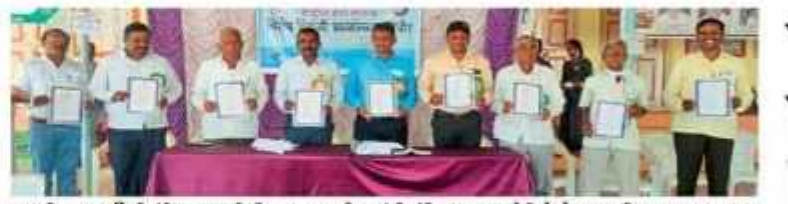
म्हसदी : धनदाईदेवी मंदिराजवळ शिबिराच्या समारोपप्रसंगी संविधानाच्या उद्देशिकेचे सामुदायिक वाचन करताना घाब्यवर.