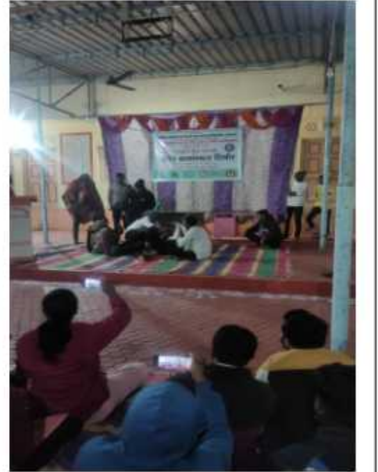
सांस्कृतिक कार्यक्रम सादर करतांना स्वयंसेवक