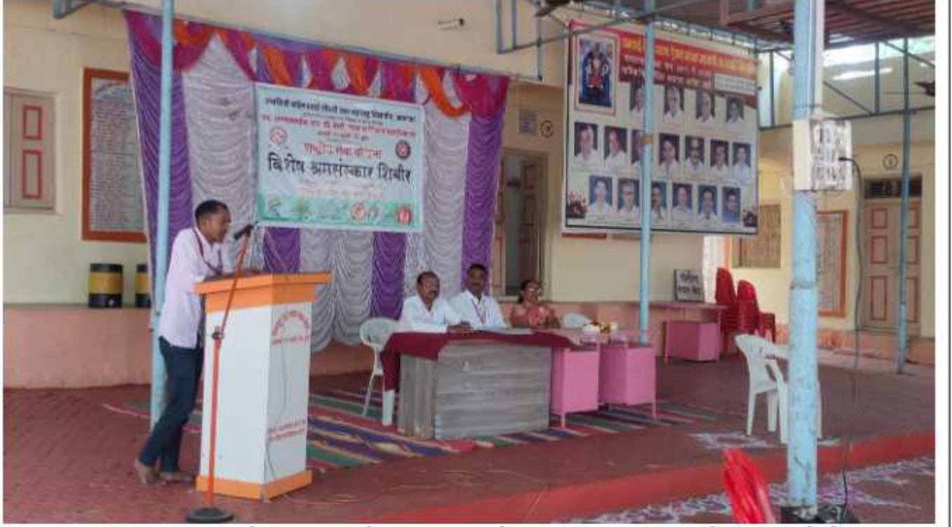
रात्रीच्या सत्रात ७.२० ते १०.०० वाजे दरम्यान स्वयंसेवकांनी सांस्कृतिक कार्यक्रम सादर केले.