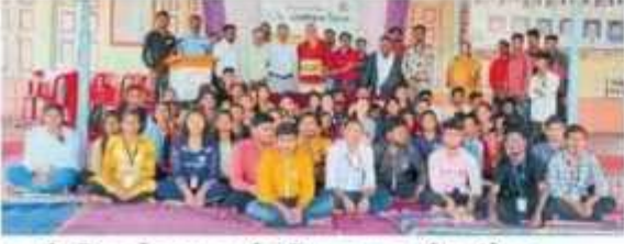
म्हसदी : सिकलसेल जनजागृती अभियानात सहभागी स्वयंसेवक.